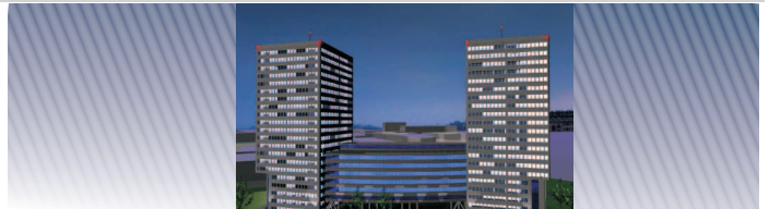
działka inwestycyjna / plot for investment

lokalizacja: Łagiewniki/Tischnera-Turowicza Atrakcyjna działka dla inwestora przeznaczenie: biurowiec powierzchnia działki : 0,97 ha WZ w trakcie realizacji przewidywana powierzchnia : 32100 PU cena: 1500/mkw PU netto umowa warunkowa możliwa