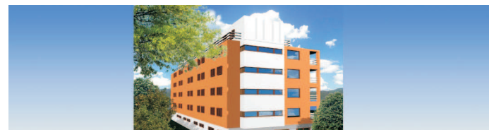
atrakcyjny wynajem / apartment fo rent

lokalizacja: Szwedzka Atrakcyjna działka dla inwestora przeznaczenie: apartamenty powierzchnia działki : 0,1 ha otoczenie: budynki XI kondygnacyjne cena: 1 200 000 PLN brutto umowa warunkowa możliwa