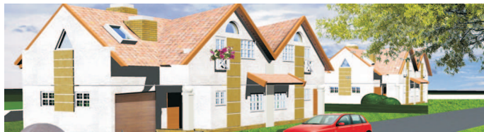
działka inwestycyjna / plot for investment

lokalizacja: Kurdwanów/Wyżynna Atrakcyjna działka dla inwestora przeznaczenie: domy w zabudowie bliźniaczej 2 bliźniaki (4 domy) powierzchnia działki : 0,16 ha WZ na ukończeniu przewidywana powierzchnia : 600 PUM cena: 400 000 PLN brutto umowa warunkowa możliwa location: Kurdwanów/Wyżynna Attractive plot for investment destination: semi-detached houses 4 houses plot's surface : 0,16 ha WZ almost ready surface of houses : 600 sqm price: 400 000 PLN preliminary contract