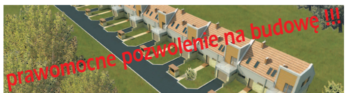
działka inwestycyjna / plot for investment

lokalizacja: Zabierzów/Brzeziny Atrakcyjna działka dla inwestora przeznaczenie: szeregówka powierzchnia działki : 0,3 ha wydane prawomocne pozwolenie na budowę 7 domów/154 mkw cena: 1 250 000 PLN netto atrakcyjne warunki płatności cena zawiera projekt