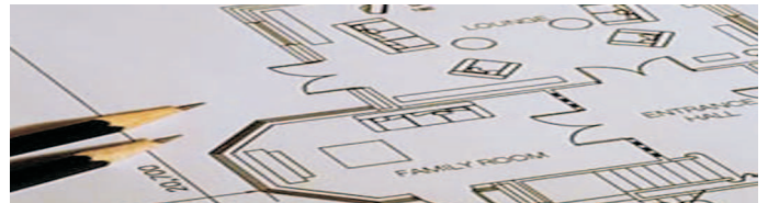
działka inwestycyjna / plot for investment

lokalizacja: Lea Atrakcyjna działka dla inwestora przeznaczenie: apartamenty otoczenie : kamienice powierzchnia działki : 0,035ha przewidywana powierzchnia : 800 mkw cena: 2500 PLN/PUM brutto umowa warunkowa