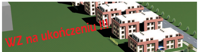
działka inwestycyjna / plot for investment

lokalizacja: Biezanów/Imielna Atrakcyjna działka dla inwestora przeznaczenie: budownictwo wielorodzinne powierzchnia działki : 2,16 ha WZ w trakcie realizacji przewidywana powierzchnia : 23100 PUM cena: 1000/mkw PUM brutto umowa warunkowa możliwa