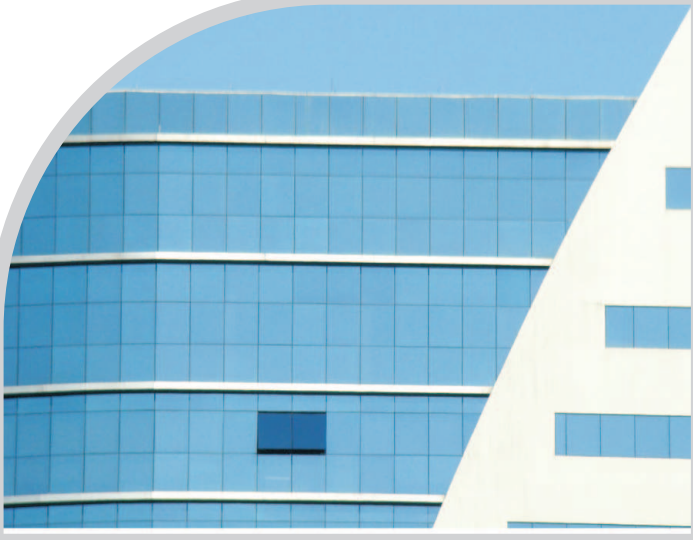
działka inwestycyjna / plot for investment